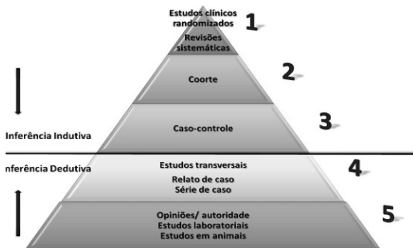
Figura 1 - Escala de evidência científica dos trabalhos.